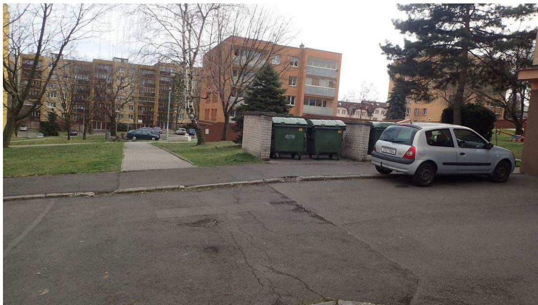
Fotografie č. 1 – demolice vozovky, chodníku, zídky kolem kontejnerových stání u domu č. 24