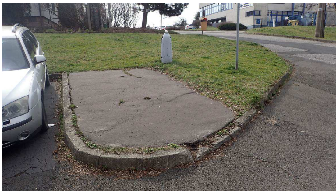
Fotografie č. 10 – demolice chodníků, vozovek, parkoviště, zbytku patice stožáru a koše na odpadky včetně základů u domu č. 18