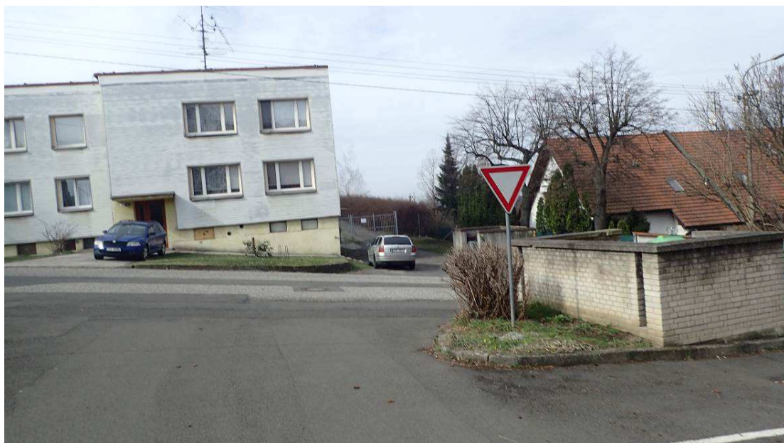
Fotografie č. 9 – demolice vozovek, parkoviště a zídky u kontejnerového stání u domu č. 18