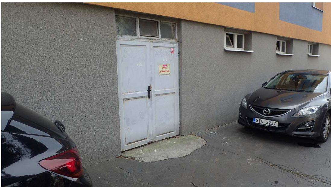
Fotografie č. 7 – demolice vybetonovaných nájezdů k domům č. 20, 24