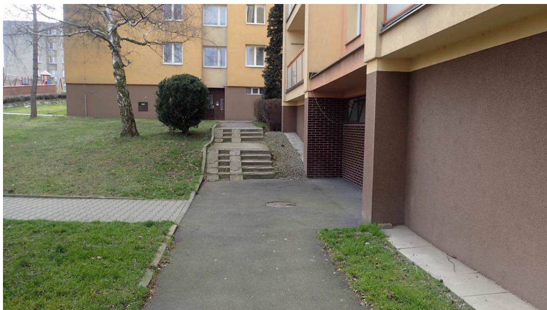
Fotografie č. 2 – demolice živých chodníků, 2 ramen schodiště u domu č. 24