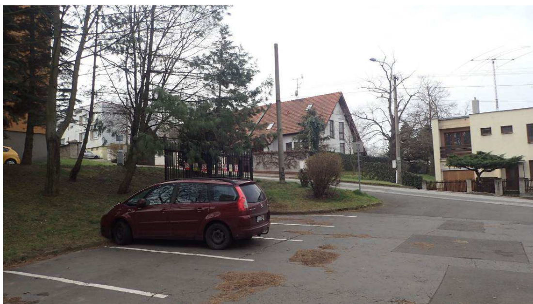
Fotografie č. 4 – demolice betonového sloupu u kutací jámy Kunhuta