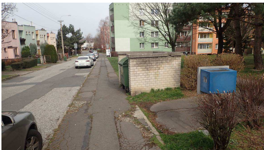
Fotografie č. 12 – demolice vozovek, chodníků, částí vjezdů a zídky a zpevněné plochy kolem kontejnerových stání u domu č. 26