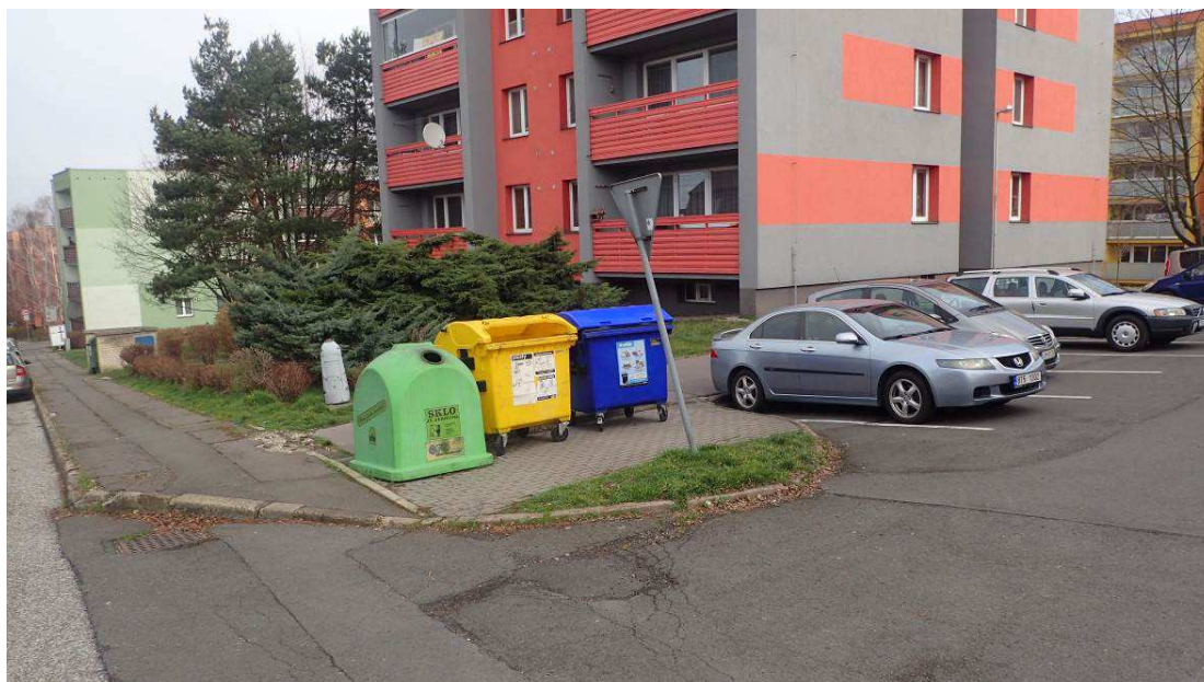
Fotografie č. 11 – demolice vozovek, chodníků, parkoviště a zbytku sloupu VO u domu č. 26