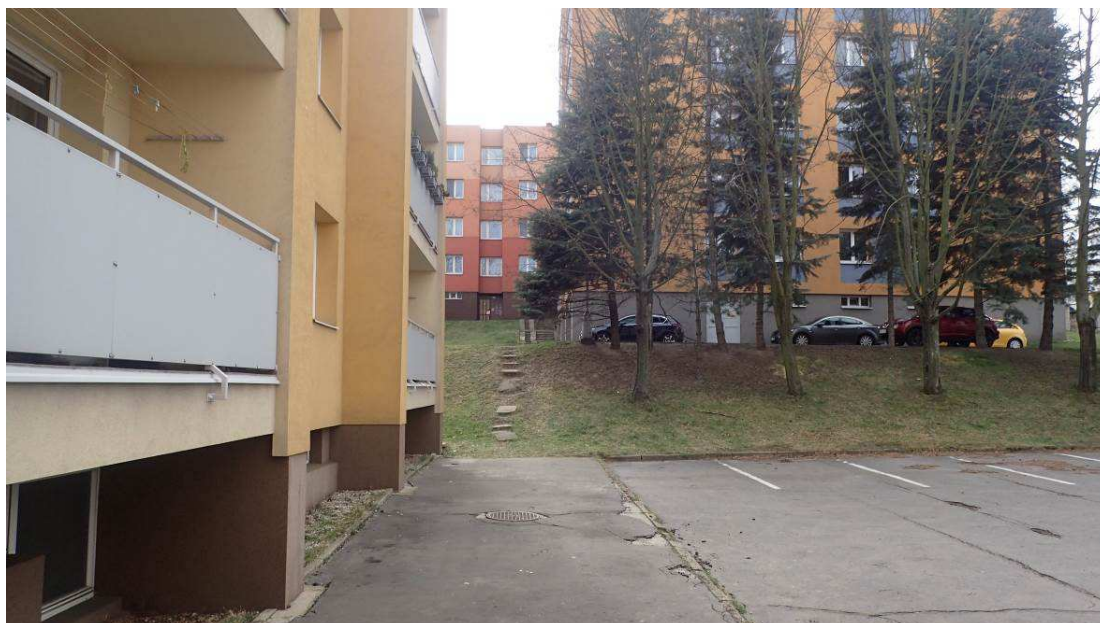
Fotografie č. 3 – demolice chodníků, vozovky, parkoviště, šlapákových chodníků u domu č. 22