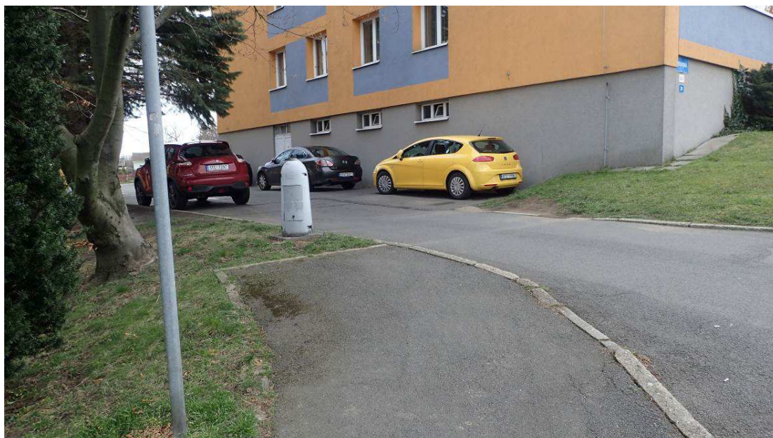
Fotografie č. 5 – demolice zbytku stožáru VO u domu č. 20