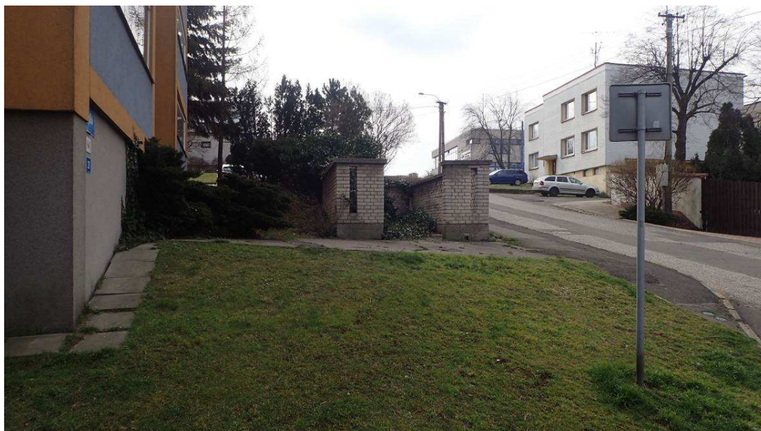
Fotografie č. 6 – demolice zídky a zpevněných ploch v místě bývalého kontejnerového stání u domu č. 20